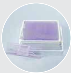
Стандартные покровные стекла