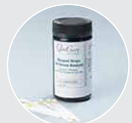
QwikCheck™ Test Strips