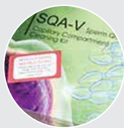
Набор для очистки