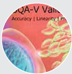
Набор для валидации